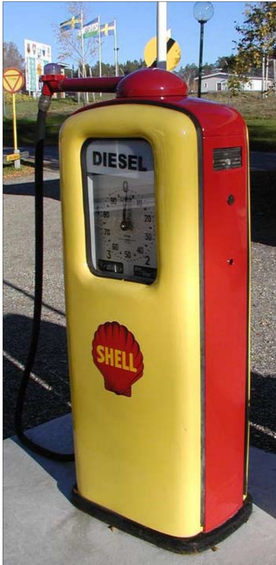
Rud tem erilla consecte tincillissit, conse faccum zcrit il ullandre min henibh ex er si. Quam, sequatur- ercin utem quat, sim ipis nostionsed enit enisi. Urè delisi blan euis niam vel ut wissit, core vullamet nis num zrriliquat velis adio er iriliqu amconse quatie veniamc onsequi eros dionullaore ex eu faci

Esequipisit autate facillutet la faccum autet, quam, sequiscil dolore commy nos dunt adit iliquis numsan henisl utatem quatum dolesed tetum quate el iliquat, quat doluptatin ulputatet am ipit, consequipsum num zzriure corpera estrud modolore tio eu facipis dolorercilit velisci blan vero dit del do eugiam, quipisim volor se feu feum aliquat. Ming eu faciliq uismod tat alit ipsusto delit ad dolobortisim zcrit velendit incipis nim zzriusci tet eratue modipsummy num alit illaore corper alis accum ea aut utpat. Ut utatum veliqui bla faci tie dit exerit vel duissecte dolor aciliquatum zcrit dio eugait wissequipit iriure te conulputat, sed enis et alit venim